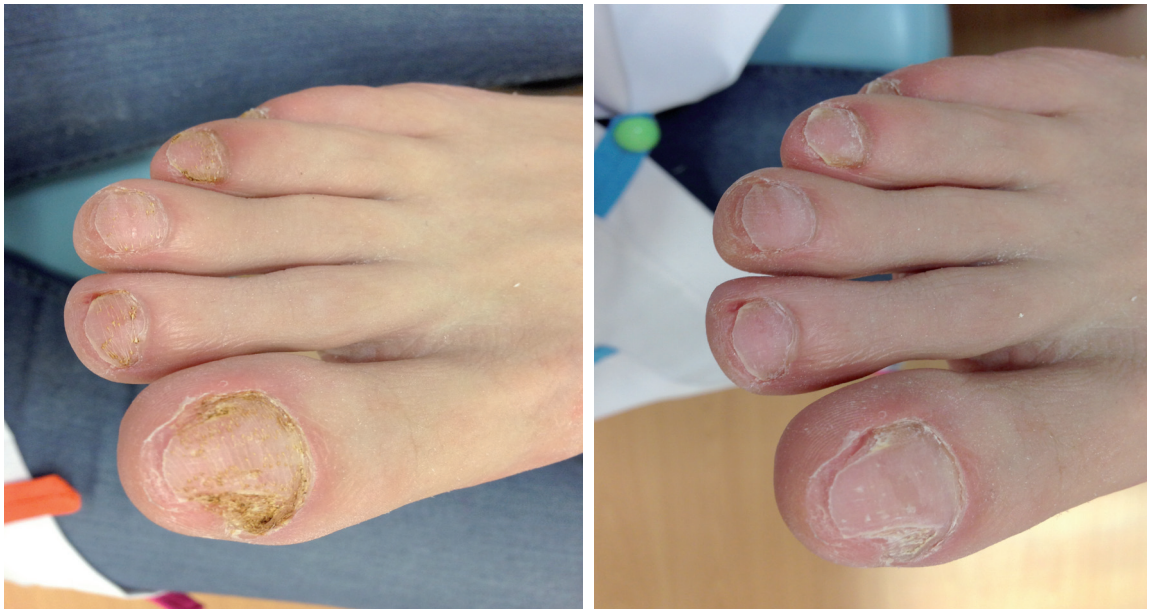
Figura 3. Aspecto de las uñas tras quiropodia antes y después de la aplicación láser.

La terapia láser de baja potencia se usa en clínica como un coadyudante en el tratamiento